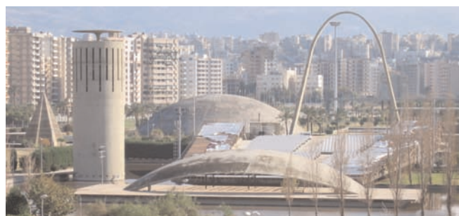
Vue d'ensemble de la Foire

tale d'une rare densité - nous avons lancé dès octobre 2004, une campagne de sensibilisation et d'alerte "Menaces sur le patrimoine de Tripoli au Liban" relayée par de nombreux média. Grâce à des actions soutenues, la menace de "village touristique" semble avoir été provisoirement écartée.