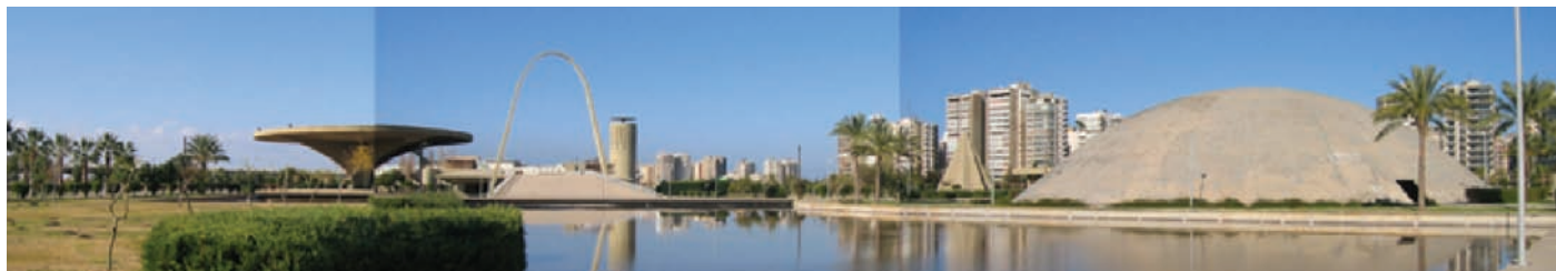
Vue d'ensemble de la Foire

La Foire Internationale de Tripoli, au Liban, œuvre majeure de l'architecte Oscar Niemeyer, est désormais inscrite sur le World Monuments Watch® list of 100 Most Endangered Sites of 2006 , programme du World Monuments Fund.